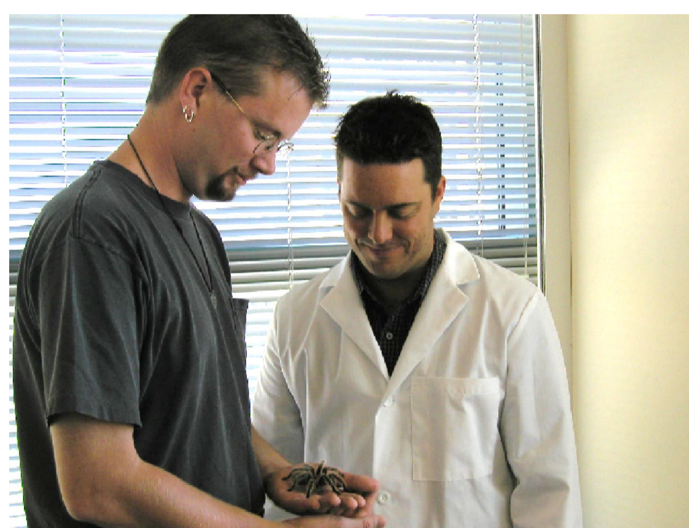
Therapie: blootstelling aan spinnen