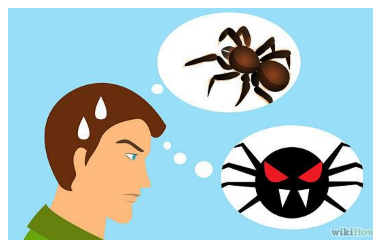
Ontstaan gedachte: spinnen zijn eng