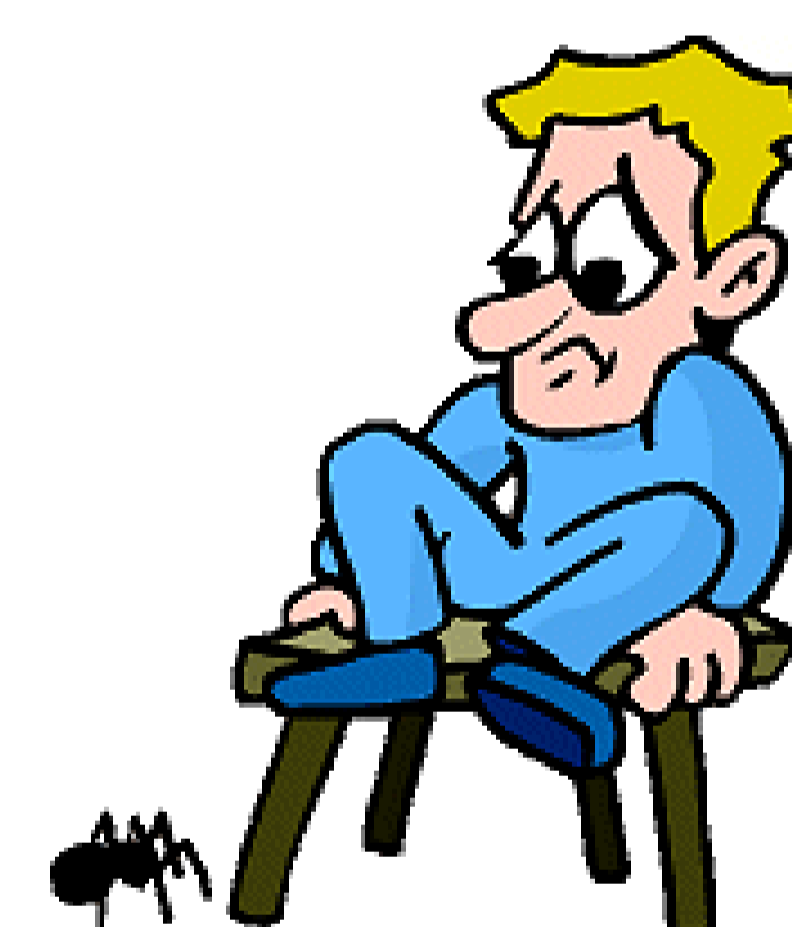
Gedrag: spinnen vermijden