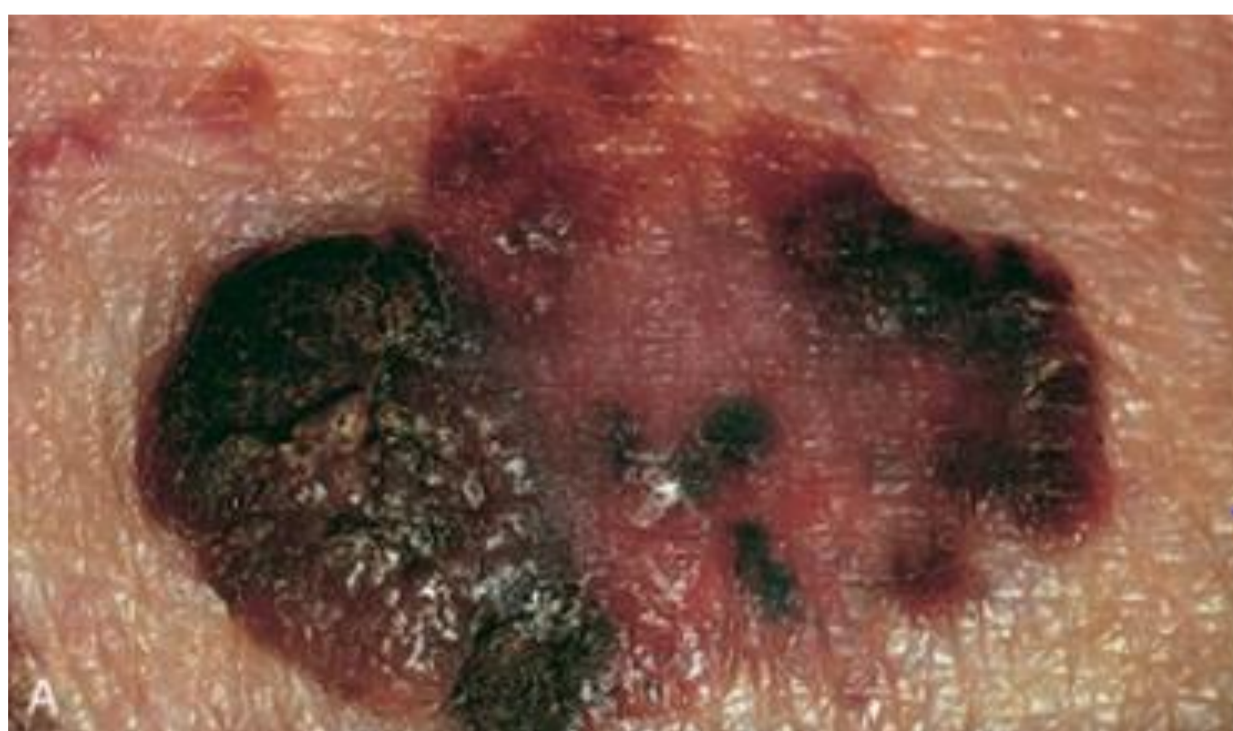
Figuur 2: een erfelijke huidkanker, melanoom, met de drie alarmsymptomen: Asymmetrie, onregelmatige begrenzing en variatie in kleur.