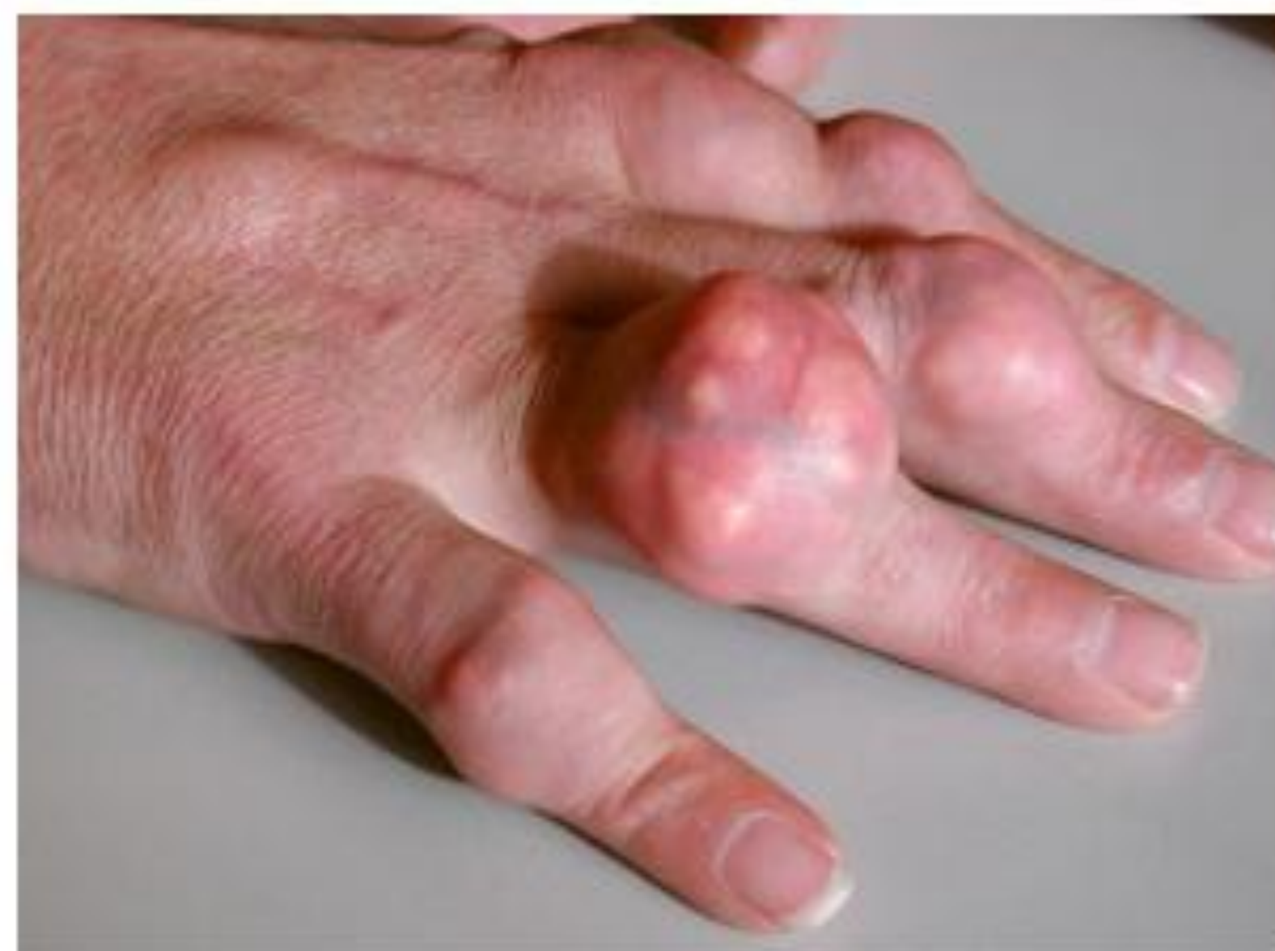
Pijnloze zwellingen bij Jicht, Tophi