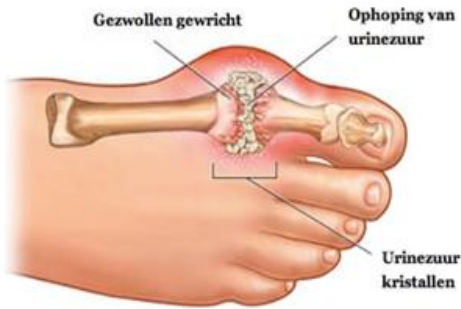
Het ontstaan van jicht