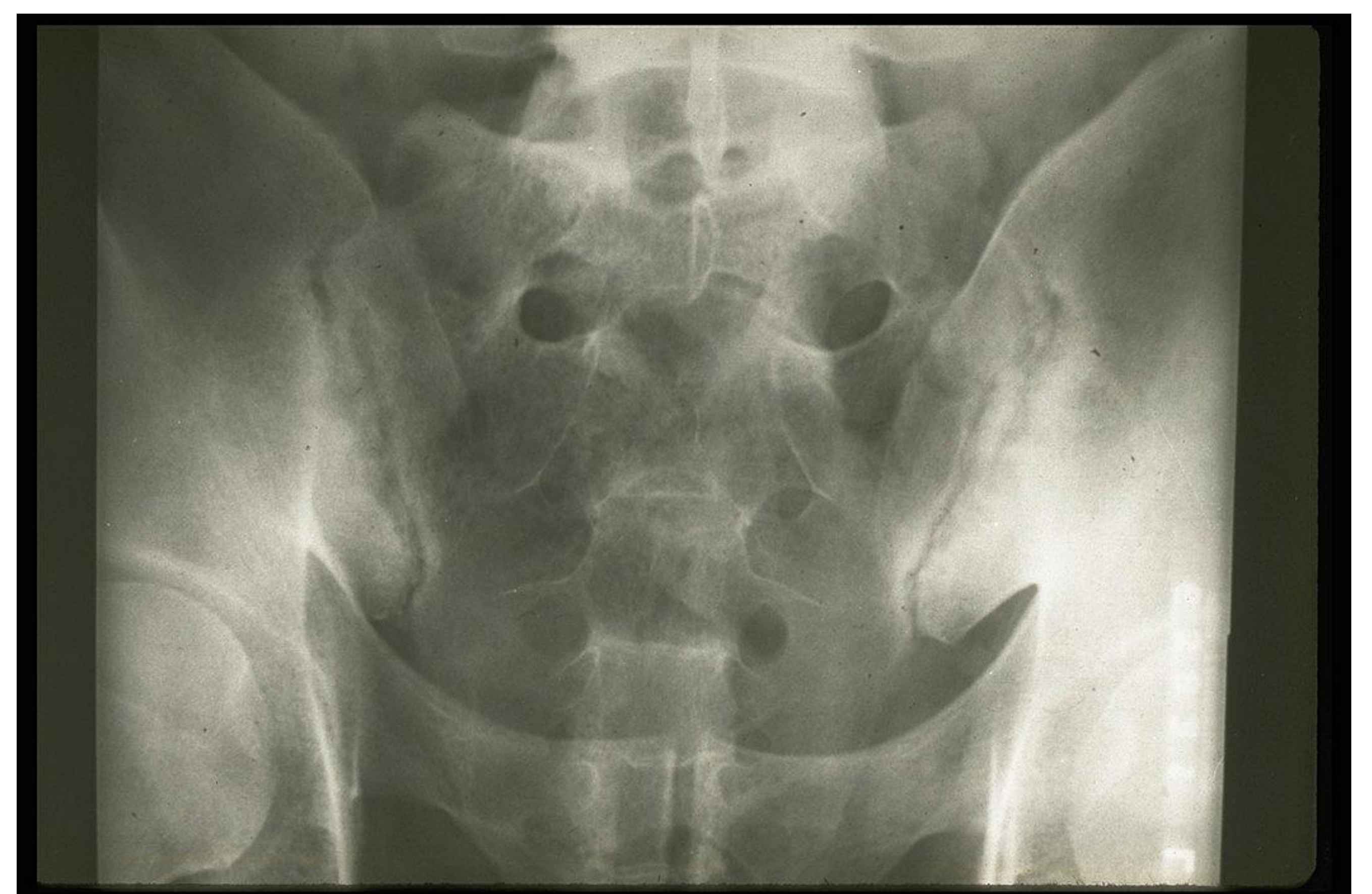
Figuur 3: Ontsteking van aanhechting wervelkolom op het bekken, typerend voor Bechterew